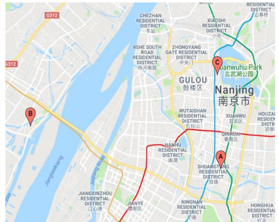
A: Grand Truvel Mandarin / B: Nanjing Youth Olympic Sports Park / C: Grand Metro Hotel